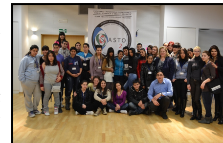
Zimska škola zastupanja za buduće profesionalce Rome u oblasti zdravlja - Andrevlje, Fruška Gora